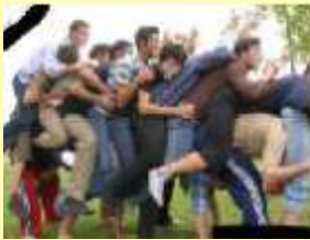
Uzun Eşek (Birdirbir)