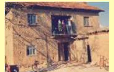
Kerpiçten Yapılan Ev

nuların başında yer alanlardır. Depreme dayanıklılığı sıfır olmasına karşılık sağlık açısından beton binalara göre daha uygun olması önemini artırmaktadır. Önceki sayfalarımda kısaca bahsetmiş olduğum Kerpiçi burada sizlere daha ayrıntılı olarak anlatmış oluyorum.