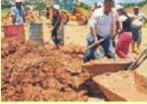
Torak Çamur Haline Getirilir

Bilindiği gibi toprak, çok eski dönemlerden beri insanların barınmak için yararlandıkları malzemelerin başta geleneklerinden biridir. Bu gün de yer yüzünde