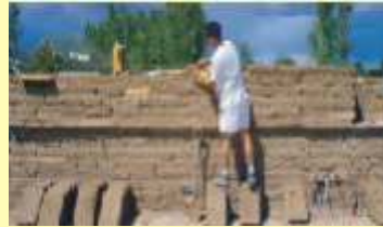
Kerpiçten duvar örülür