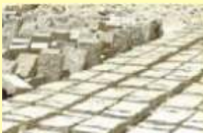
Kuruyan Kerpiçler döndürülür

yaşayan insanların büyük bir çoğunluğu, topraktan yapılmış evlerde oturmaktadırlar. Bu bir yönden toprağın yapı malzemesi olarak hemen hemen her yerde kolay ve bol tedarik edilebilmesi nedeniyle ise de,