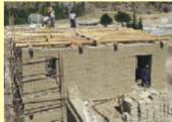
Daha sonra üzeri kapatılır