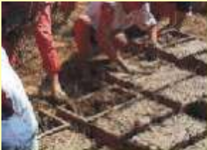
Aralarına saman, çalı-çırpı konur