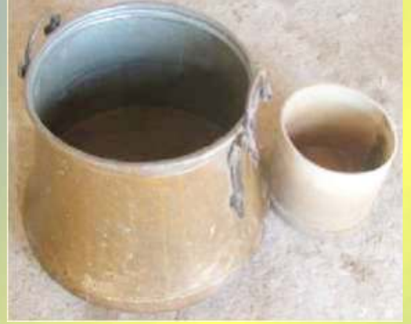
KULPLU MAYA KAZANI VE YAĞ KÜLEĞİ

Arpa ve hububat elemek için kullanılan bir alettir. Değişik işlerde kullanılan çeşitleri de vardır.