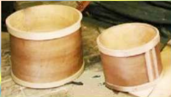
AHŞAP ve SAC ÇİNİK

Hububat ölçümünde kullanılan alet olup, yarısına urup denir. 4 urup=1 çinik, 4 çinik=1 Kile