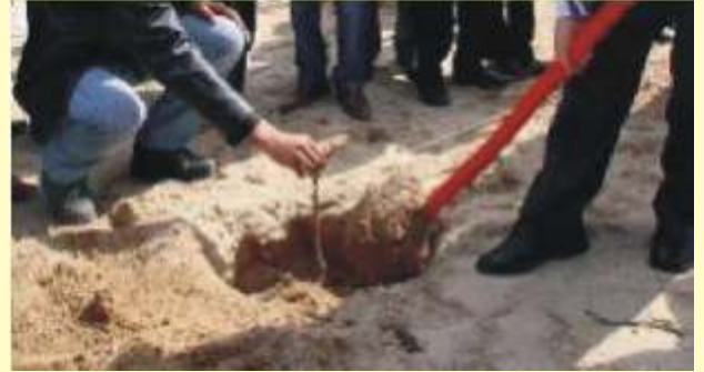
Çubuğun Krizme yapılmış Toprağa Dikilişi.

Toprak içerisinde hiçbir ot ştili (kökü) ve taş v.s. kalmasına özellikle dikkat edilirdi.