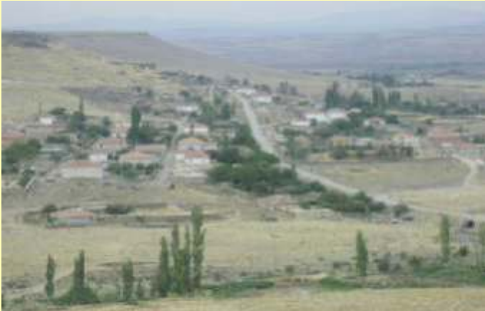
Suçikan mevkiinde 30 Evler ve Topçu'nun görünümü.