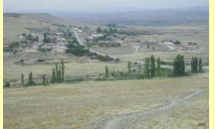
Suçikan mevkiinde 30 Evler ve Topçu'nun görünümü.