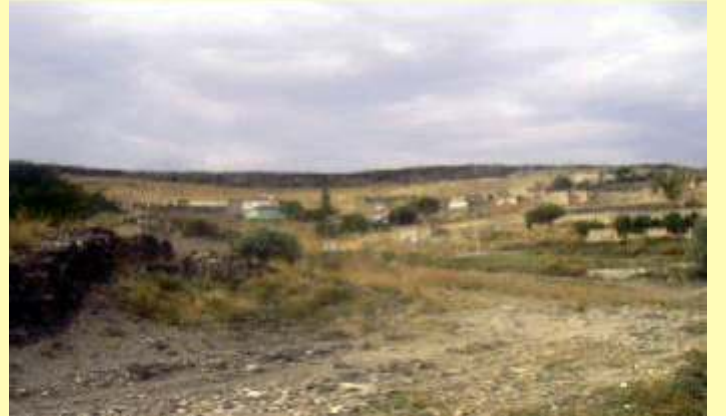
Çeşmenin altında Cami ve Kuşçu'ların arası Aydoğmuş.